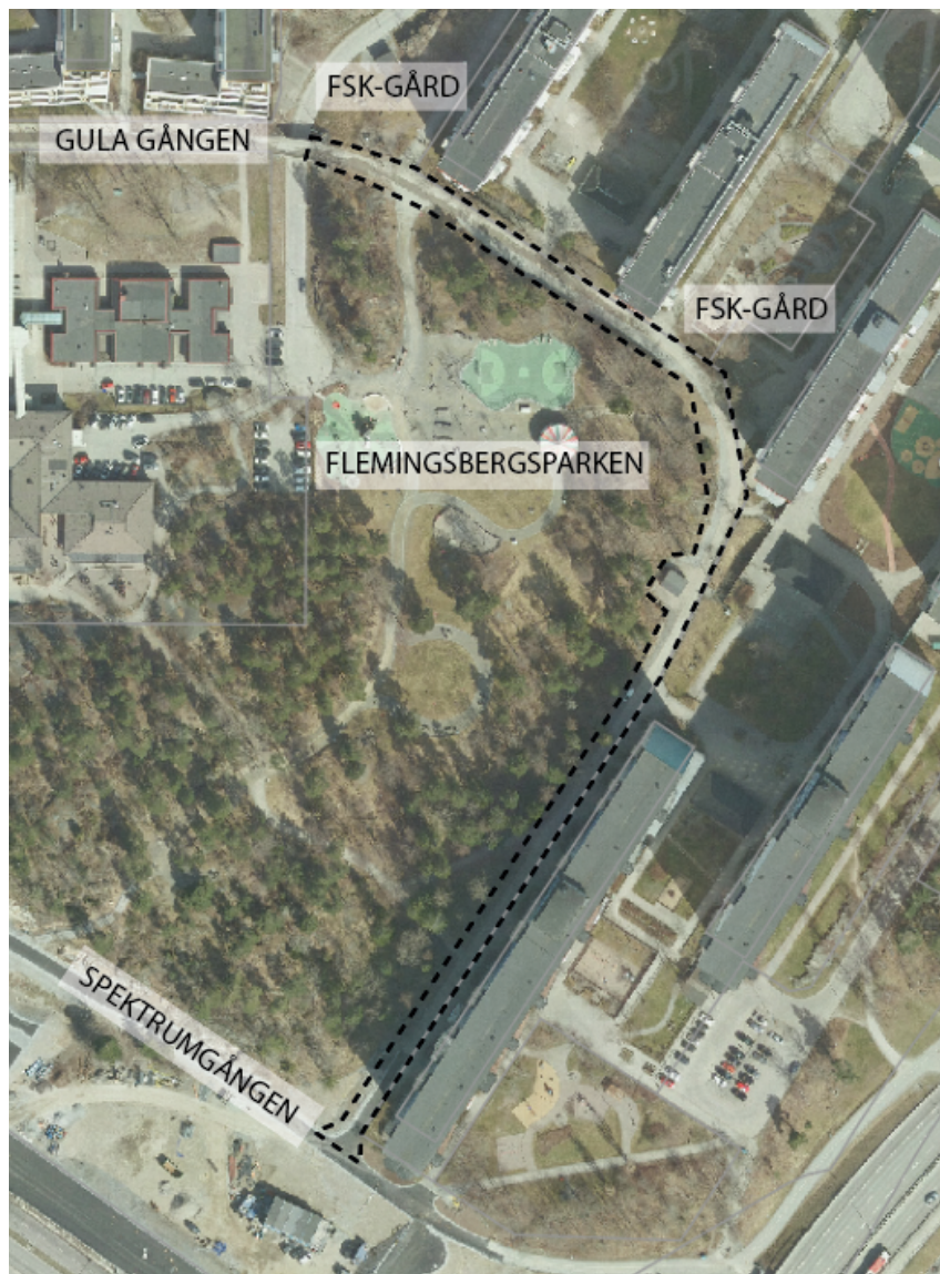
Figur 1. Flygbild där gångstråket är markerat med streckad linje.